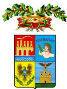
Libero Consorzio Comunale di Trapani