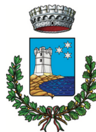
Comune di Valderice