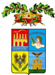
Libero Consorzio Comunale di Trapani