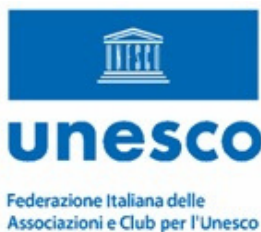
Club per l'UNESCO di Trapani