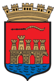
Comune di Trapani